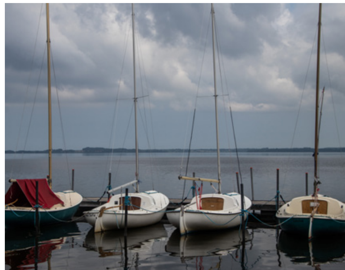
Lynæs 14 kølbåde.

udstyret med det næststørste sejl, så er det damerne, der bruger den til olympiadesejls. Det er klart, at det er en jolle, der giver udfordringer, men den er sjov at sejle, når man kan.