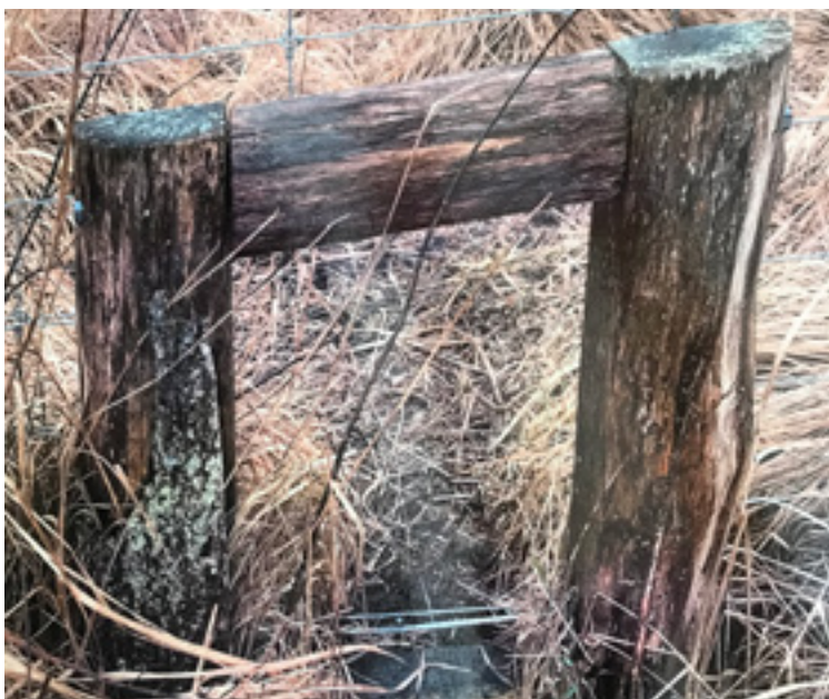
Én af åbningerne til smådyr, incl rådyr. Måler ca. 35x50 cm.

Der er to af skovens medarbejdere, der får ansvar for at holde øje med dyrenes trivsel hver eneste dag. Mange af dyrene får desuden en gps på, så deres færden registreres. Det er også vigtigt at ingen dyr kan sidde fast i hegnet. Det vil der blive holdt nøje øje med. Det uheld er fx sket i