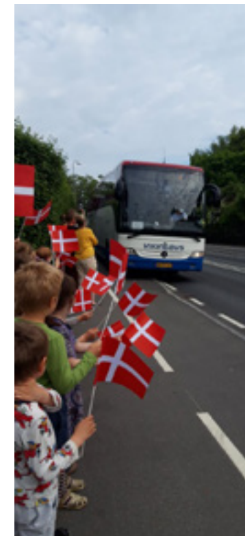
Farvel til 5A

Skolebørnene har haft ferie i næsten 6 uger. HFO'en har haft åbent, og der har som sædvanligt været en hel del sjove aktiviteter. Fra den første uge, fik vi mulighed for at blande børnene