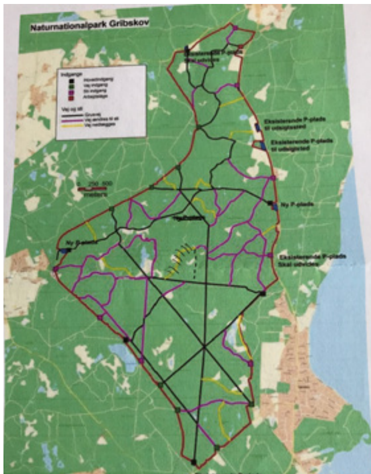
Foreløbig skitse over stier og grænser i Naturnationalparken i Gribskov.

I dag er forskellen ikke særlig stor. Både skov og park er kontrolleret