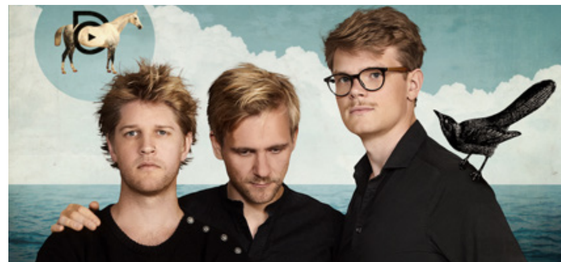
Der var udsolgt sidst folkemusikgruppen Dreamers' Circus spillede på kroen.