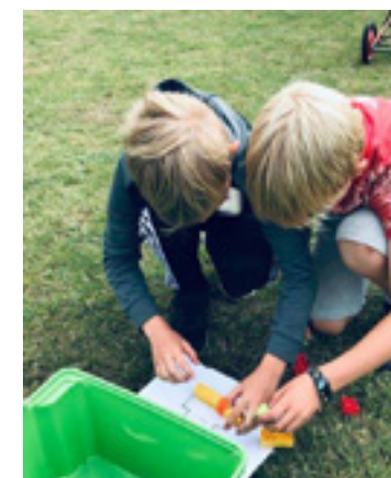
Mooncarrace med samarbejdsøvelse

så de ældste og de yngste kunne få glæde af hinanden, det har været dejligt at børnene har kunnet lege på kryds og tværs uden restriktioner.