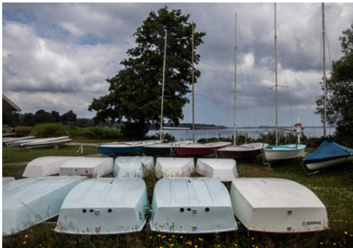
Enmandsjoller til børn og voksne.

købe tre nye Terajoller, som er en juniorjolle, der sejler lidt stærkere, og er lidt livligere end optimistjollen. Vi har satset en del på Laserjollen, som er en overgangsjolle fra optimistjolle, men også en livlig jolle for seniorer. Det kan lade sig gøre fordi der er tre forskellige størrelser sejl til jollen, der dækker vægtklasser fra 40 kg til plus 80 kg. Når jollen er udstyret med det største sejl, er det en af de bådtyper, der bruges af mændene, når der sejles olympiadesejls, og når den er