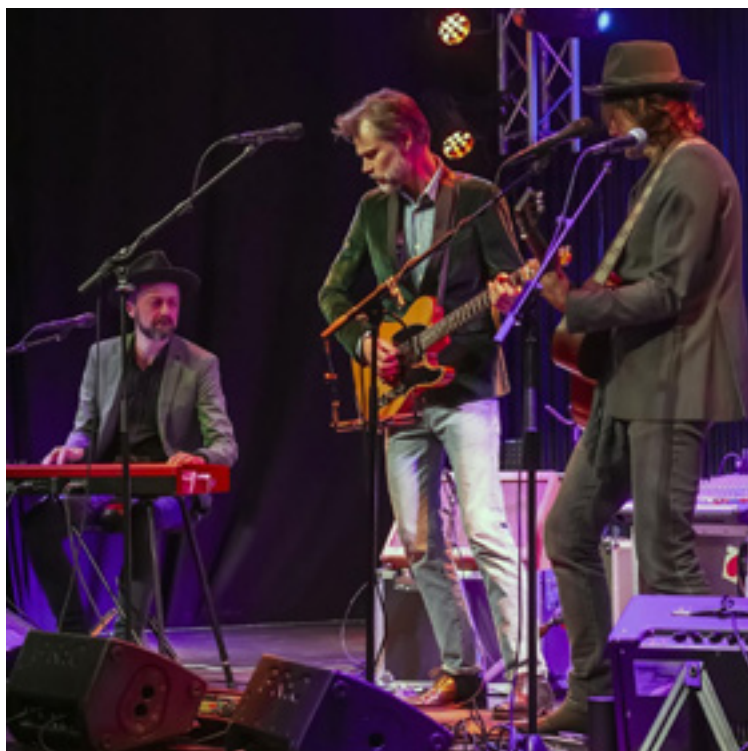
Dissing & Las gæster kroen sidst i oktober.

Til en del af arrangementerne har vi lavet nummererede pladser, fordi vi regner med, at der kommer mange, og det derfor er hensigtsmæssigt, at man i forvejen ved, hvor man skal sidde. Der bliver rift om billetterne, så