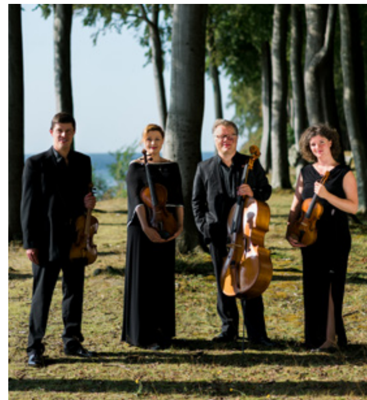
I foråret 2022 gæster tyske Henschel Quartet kroen.