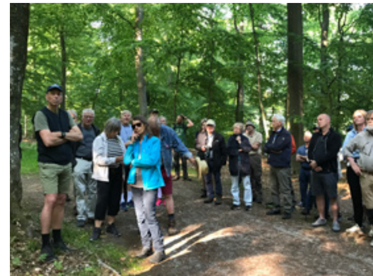
Skovvandring om Naturnationalparken i starten af juli.

Når også den største del af Gribskov er udlagt til 'urørt skov', bliver der god mulighed for at måle på effekten af at have udlagt de 25 pct. til Naturnationalpark. Der vil det første,